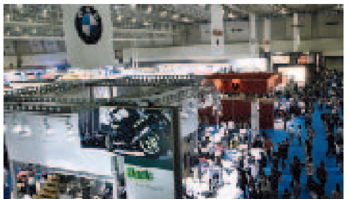
輸入車の展示も盛況で、6つのブースに8ブランドが出展