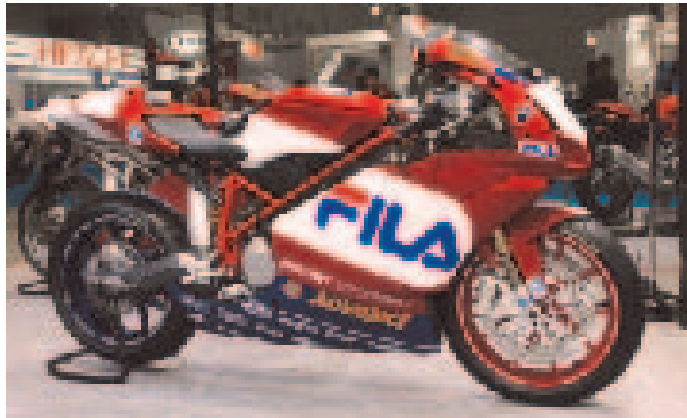
ブランドイメージ浸透の先頭に立つドゥカティ「999R Fila」