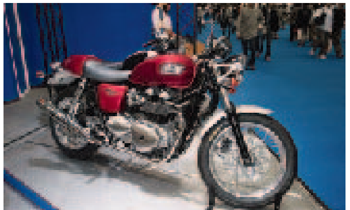
ホットなモデルのトライアンフ「スラクストン900」