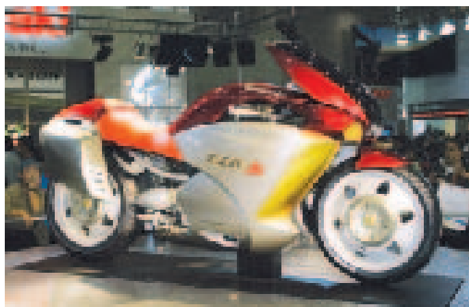
高速クルージングとスポーツ性を備えたカワサキ「ZZR-X」