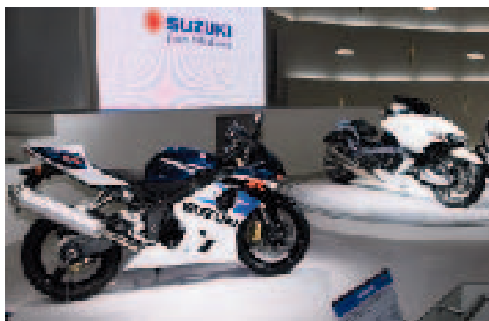
スズキが提案する参考出品モデル「GSX-R750」(左)と「G-STRIDER」