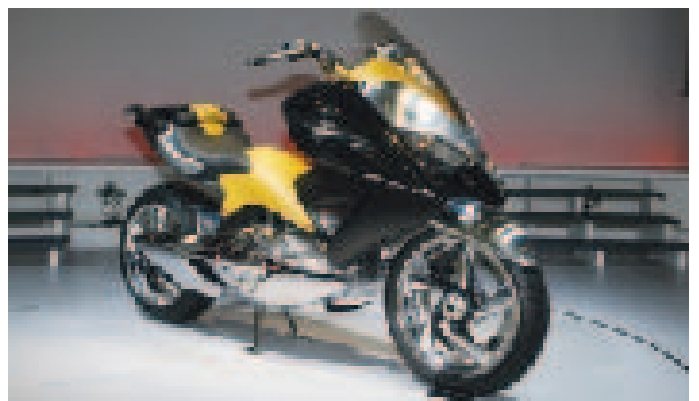
ホンダのメイン展示のうちの1台「GRIFFON」

また市販予定車として、ロー&ロングスタイルの「シャドウ<750>」、チャンピオンマシンRC211Vのテクノロジーを受け継いだ「CBR1000RR」、新開発の「CB400スーパーフォア・ハイパーVTECスペックIII」や、世界で初めて4ストローク50ccエンジンに燃料噴射装置を採用したスクーター「Dio Z4 FI」などの参考出品モデルが目玉を集めている。