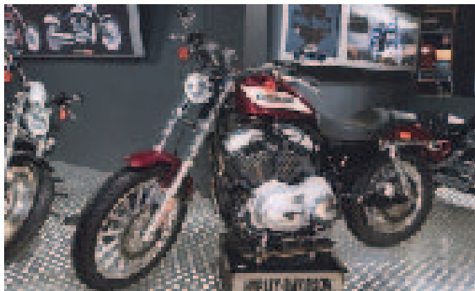
伝統的なモデルとして人気のハーレーダビットソン「XL1200R」