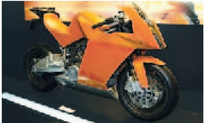
KTMがロードレースへの参戦を狙う「990RC8」