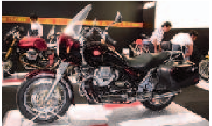
アメリカンタイプで人気のモトグッツィ「California EVツーリング」