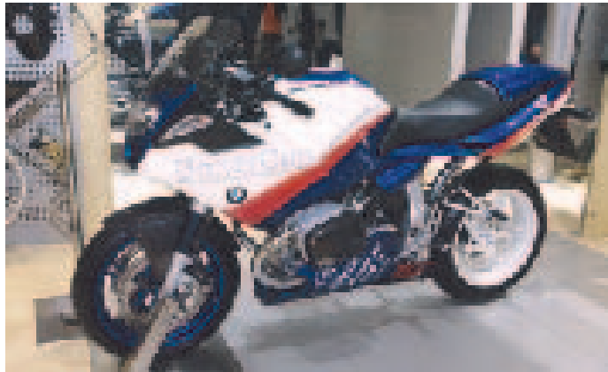
Boxer Cupレース2004年モデルレプリカの「R1100 S」

トライアンフ はベストセラーの「ボンネビル/ボンネビルT100」をベースにした日本初公開の「スラクストン900」をはじめ伝統を継承したモデルに加えて、今年のマン島レースで優勝したマシンのベースモデル「デイトナ600」を展示、往年のトライアンフ・ファンの関心も集めている。