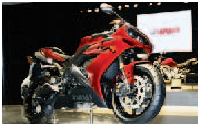
エキサイティングな走りをイメージするヤマハ「YZF-R1」

サーキットやフィールドでお馴染みのライムグリーンカラーリング・マシンが並ぶカワサキのブース。正面ターンテーブルでは、超ド級クルーザー「VN2000」とカットエンジンが「カワサキのイズム」を主張。また、中央のターンテーブルに乗せられたコンセプトモデル「ZZR-X」は、走りに応じたライディングポジションや機能が選択できるモードチェンジ機構を採用するなど、ハイスピードツアーの理想形を提案したマルチパーパスモデルだ。