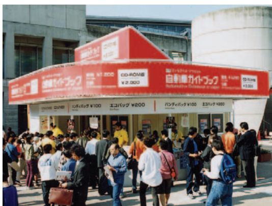
▲ 第35回ショー 自動車ガイドブック売場 Automotive Guidebook store at the 35th Show.

The "Automotive Guidebook of Japan" has long been a must-read for the industry and motor fans. This year it reaches Vol. 50, and in honor of this occasion we have completely reworked the book, making it easier to read, easier to use, and better suited to today's needs. We have also published a reprint of Vol.1 in commemoration of this milestone, which will be available only at the Show.