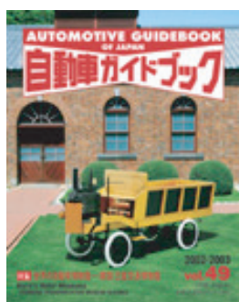
▲自動車ガイドブックVol.49 Automotive Guide Book of Japan Vol. 49