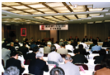
記者発表会 会場風景 Press conference

On Thursday, September 19, the Japan Automobile Manufacturers Association held an orientation meeting on the "36th Tokyo Motor Show" for members of the mass media. Representatives of newspapers, broadcasters, magazines and other media organizations attended both a press announcement from the Secretariat (the Tokyo Motor Show Department of the Japan Automobile Manufacturers Association) and a regular press conference by the Association during which an outline of the show was